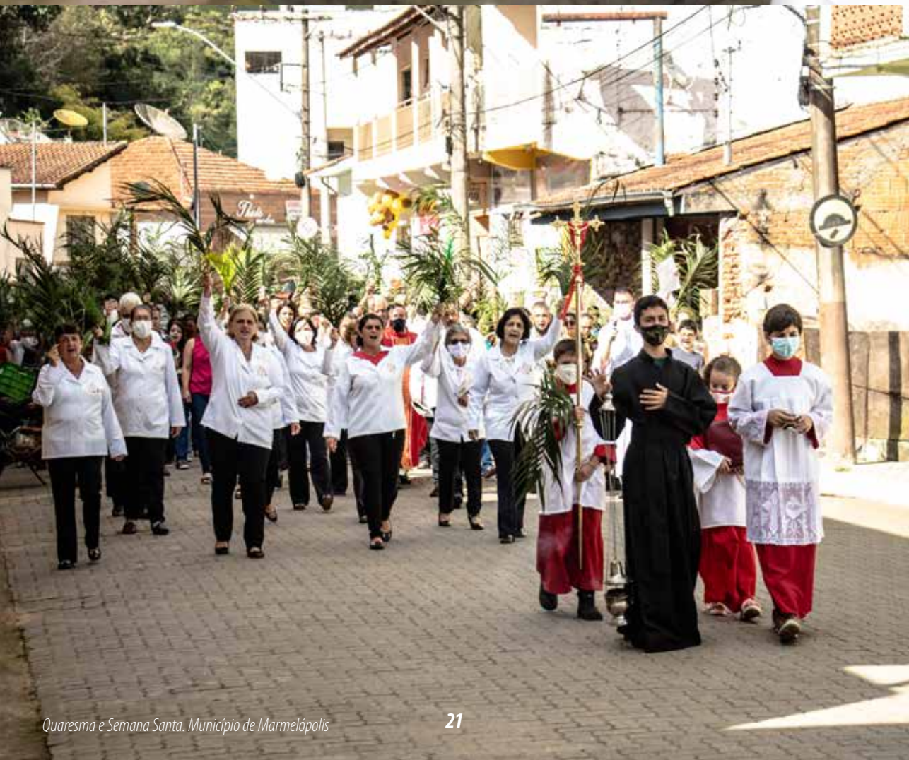
Quaresma e Semana Santa. Município de Marmelópolis