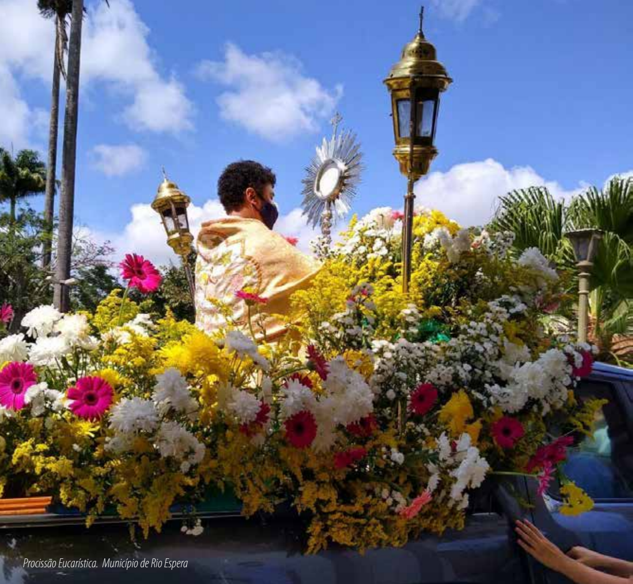
Procissão Eucarística. Município de Rio Espera