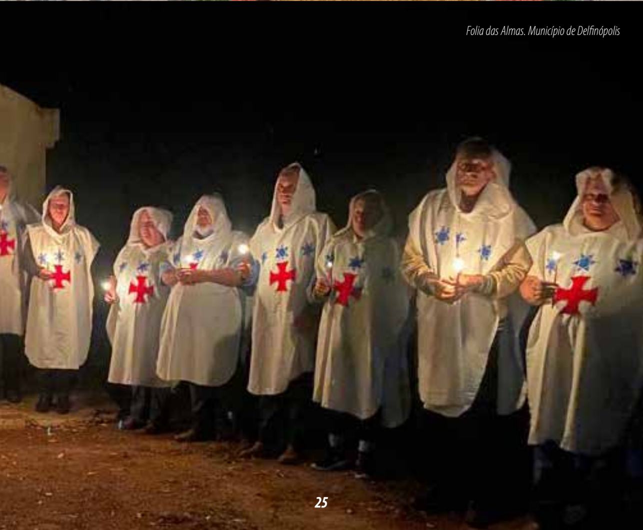
Folia das Almas. Município de Delfinópolis