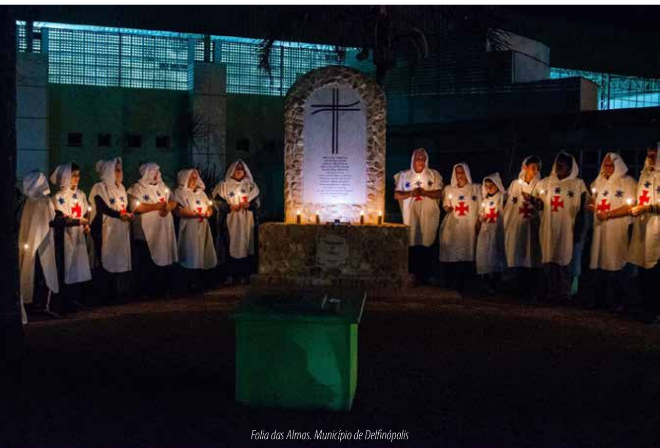
Folia das Almas. Município de Delfinópolis

Em relação aos ritos católicos, registramos a Folia das Almas , cadastrada pelos municípios de São José da Barra e Delfinópolis, região Sul/Sudoeste do estado. Em São José da Barra, o rito da Folia foi definido como um composto de cantos lamentosos, geralmente de caráter fúnebre, em que os participantes rezam pelas almas de seus familiares já falecidos ou pelas almas daqueles para os quais se considera a necessidade de orações como, por exemplo, as almas do purgatório, as almas de determinado cemitério, as almas dos afogados e de vários outros necessitados. Já o cadastro feito por Delfinópolis, informa um rito em que se caminha durante a noite em visita às casas, capelas, monumentos, cruzeiros e igrejas, para rezar em memória das almas dos falecidos na região do Vale da Gurita e da Canastra. Pronunciando orações e com cantos acompanhados pelo som de matracas, berra-bois, réu-réu e o apito do capitão, o cadastro informa uma tradição que resiste ao longo de anos. A Folia das Almas, portanto, correlaciona-se com a Encomendação das Almas, inventariada na região do Rio São Francisco, como já mencionado, chamando atenção a diferença entre as indumentárias de cada uma.