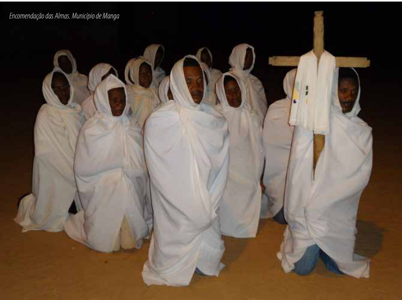
Encomendação das Almas. Município de Manga

A Encomendação das Almas, rito identificado no contexto do Inventário Cultural de Proteção do Rio São Francisco, realizado pelo Iepha-MG entre 2012 e 2015, é uma prática que ocorre em vários municípios de Minas Gerais e do Brasil, sendo realizada de diferentes maneiras e guardando singularidades próprias de cada lugar. O rito inventariado no município de Manga, região do Médio São Francisco, é realizado durante a quaresma a partir da ideia de rezar pelas almas que estão no purgatório, para que encontrem o caminho do céu e alcancem sossego e alívio de suas penas. À margem esquerda do rio, está a Comunidade Quilombola de Justa II, onde os responsáveis pela Encomendação mantêm suas origens, saindo durante as madrugadas do período quaresmal, rogando pela alma dos amigos e parentes que já se foram, por todas as almas do purgatório, pelas almas dos falecidos enterrados no cemitério, dos afogados, dos assassinados, entre outras. Os participantes se vestem com um tecido branco, cobrindo todo o corpo, deixando somente o rosto exposto. Os organizadores são responsáveis por conduzir a matraca (instrumento que produz som agudo) e a cruz. Segundo antigo costume, as pessoas que moram nas casas ao longo do trajeto da procissão devem fechar suas janelas ao ouvirem o grupo se aproximando.