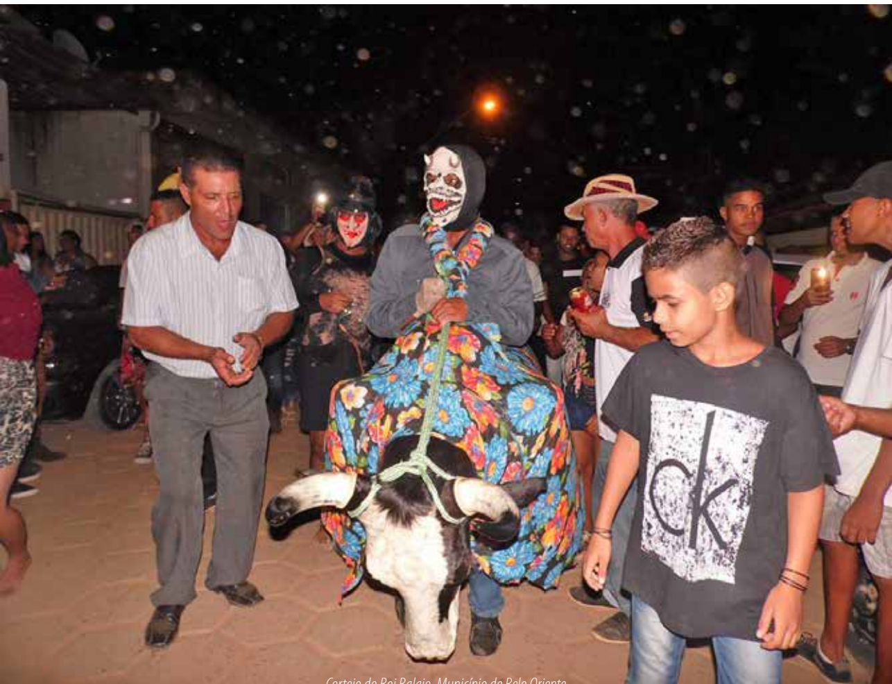
Cortejo do Boi Balaio. Município de Belo Oriente