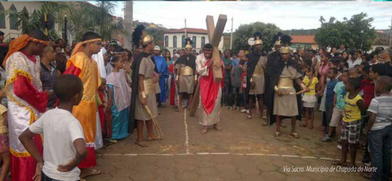
Via Sacra. Município de Chapada do Norte