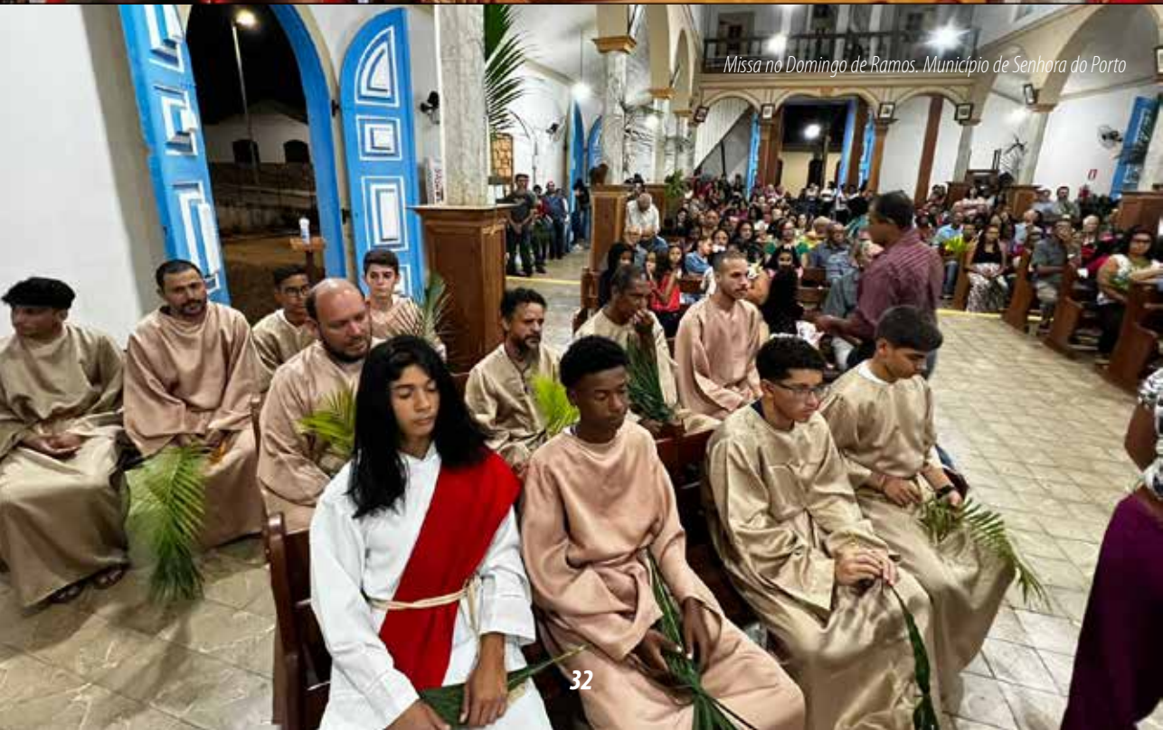
Missa no Domingo de Ramos. Município de Senhora do Porto