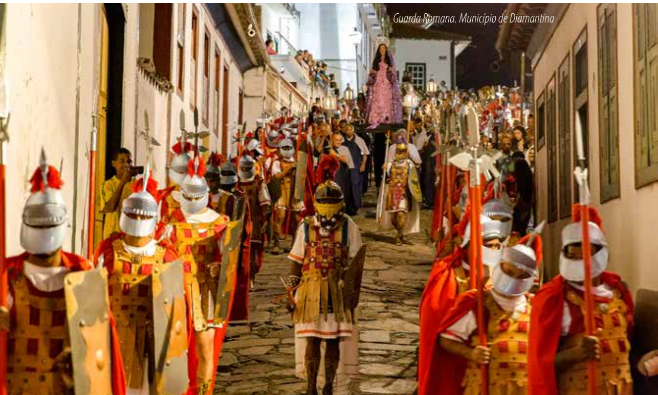
Guarda Romana. Município de Diamantina

Em Diamantina, o cadastro destacou o evento religioso Guarda Romana de Diamantina, “um grupo de mais de 80 homens que se organiza a quase cem anos para, anualmente, participar da celebração da Semana Santa”. Esse grupo sai às ruas de Diamantina encenando os passos e a paixão de Jesus Cristo. Eles usam escudos e alabardas e marcham lentamente pela cidade em procissão. Ao caminhar, batem fortemente os pés e as alabardas no chão, performando ritmo e coreografia que se juntam à paisagem da cidade expressando a sua fé. O cadastro informa que a celebração tem ocorrido no município há mais de 100 anos, de modo que a Guarda Romana foi reconhecida como patrimônio cultural do município, conforme informado no cadastro.