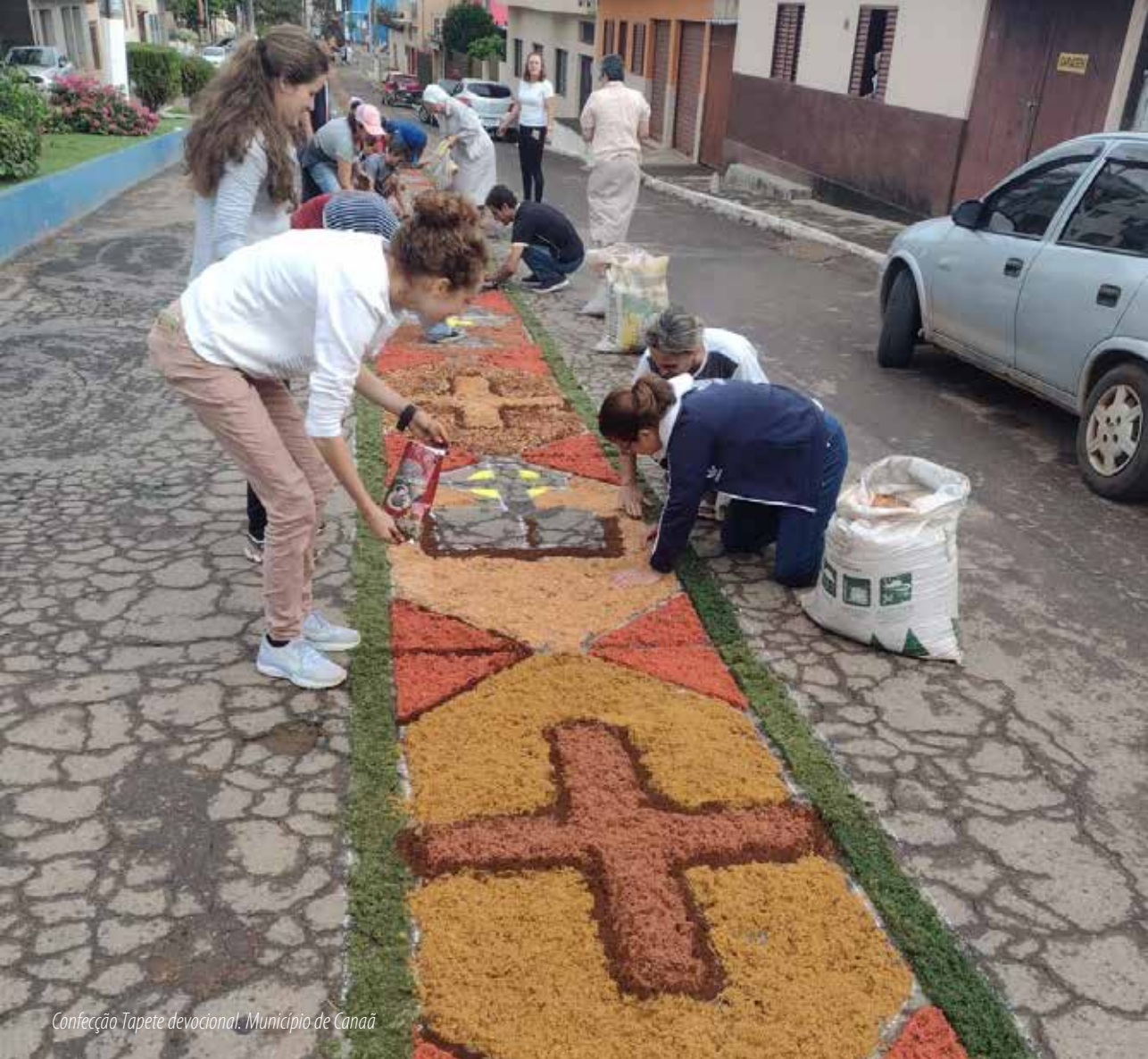
Confecção Tapete devocional. Município de Canaã