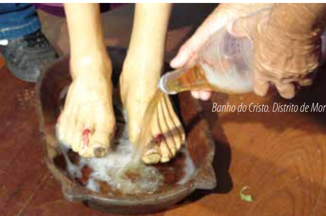
Banho do Cristo. Distrito de Morro Velho, Município de Caeté