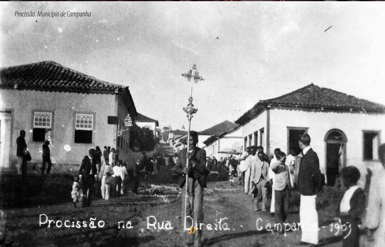
Procissão. Município de Campanha

Procissão na Rua Direita. - Campanha - 1903