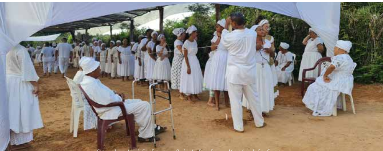
Feitura do cordão de São Francisco – Quilombo Pena Branca, Município de São Francisco

No contexto de ritos realizados por religiões de matriz africana no período, foram levantados o recolhimento de filhos de santo, a realização do Lorogun e a feitura de materiais rituais. Um dos exemplos é o da Feitura do Cordão de São Francisco , que foi cadastrado pelo município de São Francisco, região norte mineira, e realizado na comunidade do Quilombo Pena Branca. Trata-se da confecção artesanal do cordão de São Francisco, produzido com a matéria-prima do algodão e, conforme os fundamentos da comunidade, deve ser realizado ritualmente nas sextas-feiras santas , o que ocorre há mais de 60 anos. Segundo dados do cadastro, a feitura do cordão teve origem com a construção da primeira “casa de reza”, que deu origem ao terreiro de umbanda e ao quilombo. A matriarca do terreiro aprendeu o ofício com suas ancestrais e o transmite para as novas gerações da comunidade.