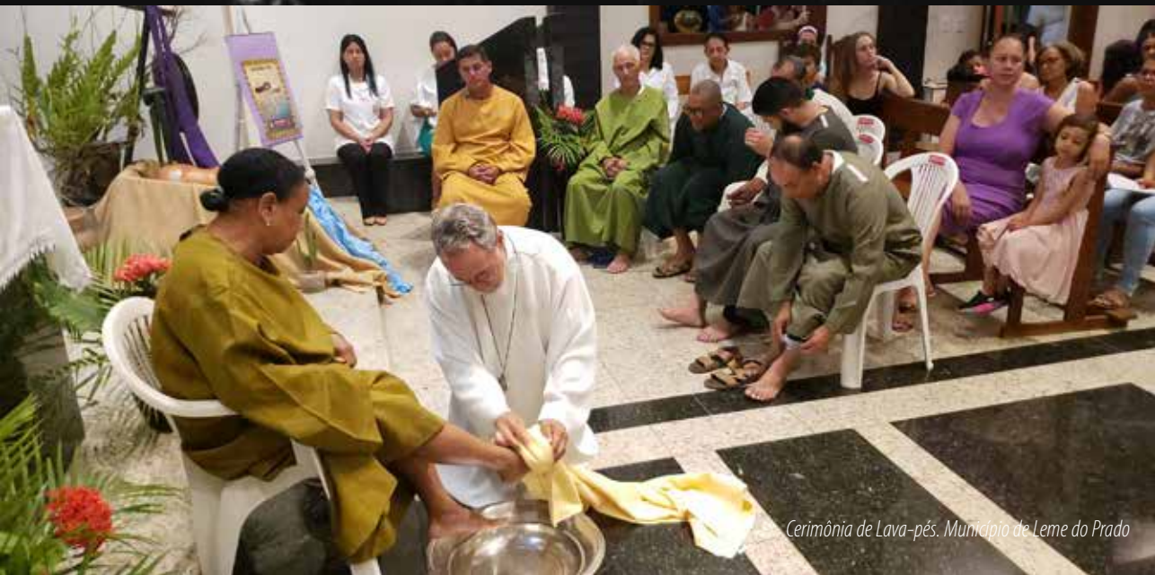
Cerimônia de Lava-pés. Município de Leme do Prado