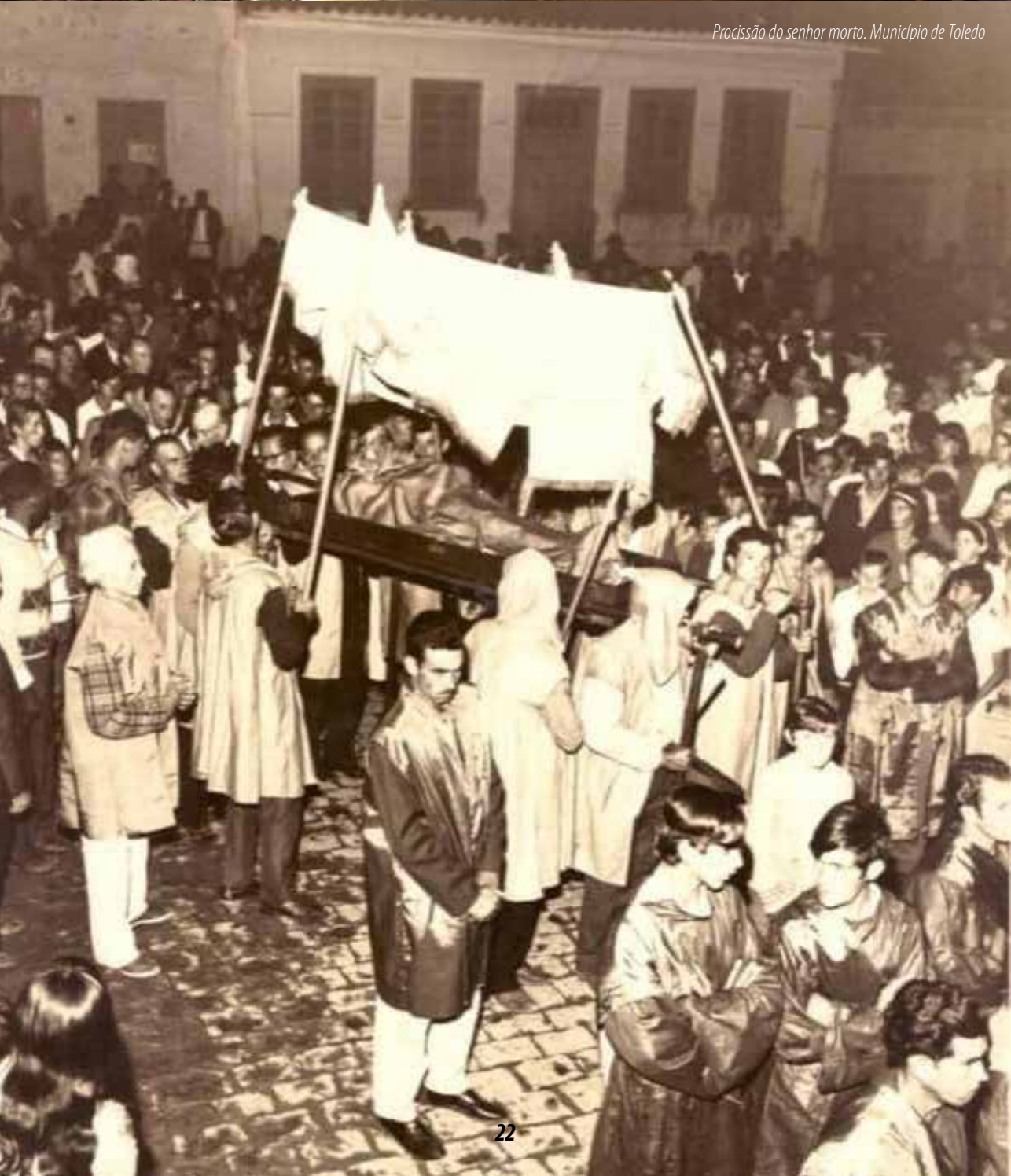
Procissão do senhor morto. Município de Toledo