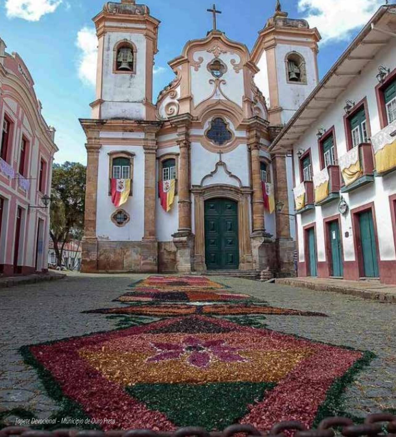
Tapete Devocional - Município de Ouro Preto