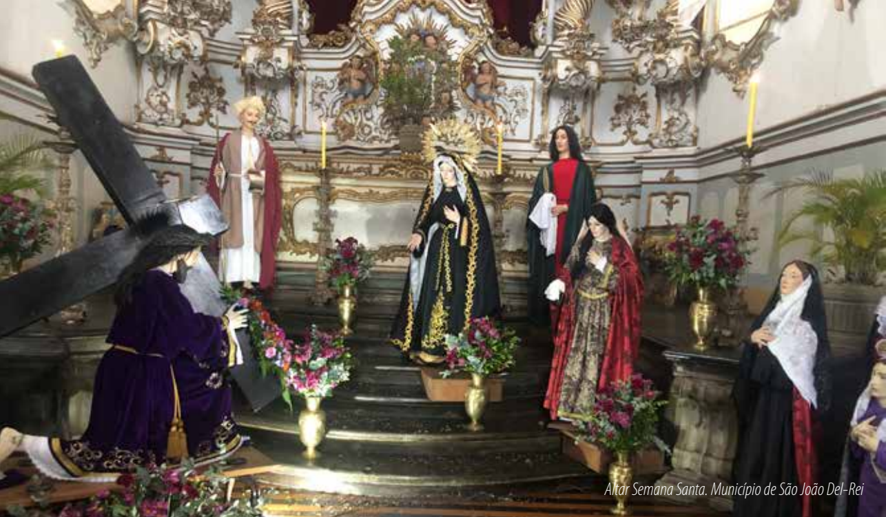
Altar Semana Santa. Município de São João Del-Rei