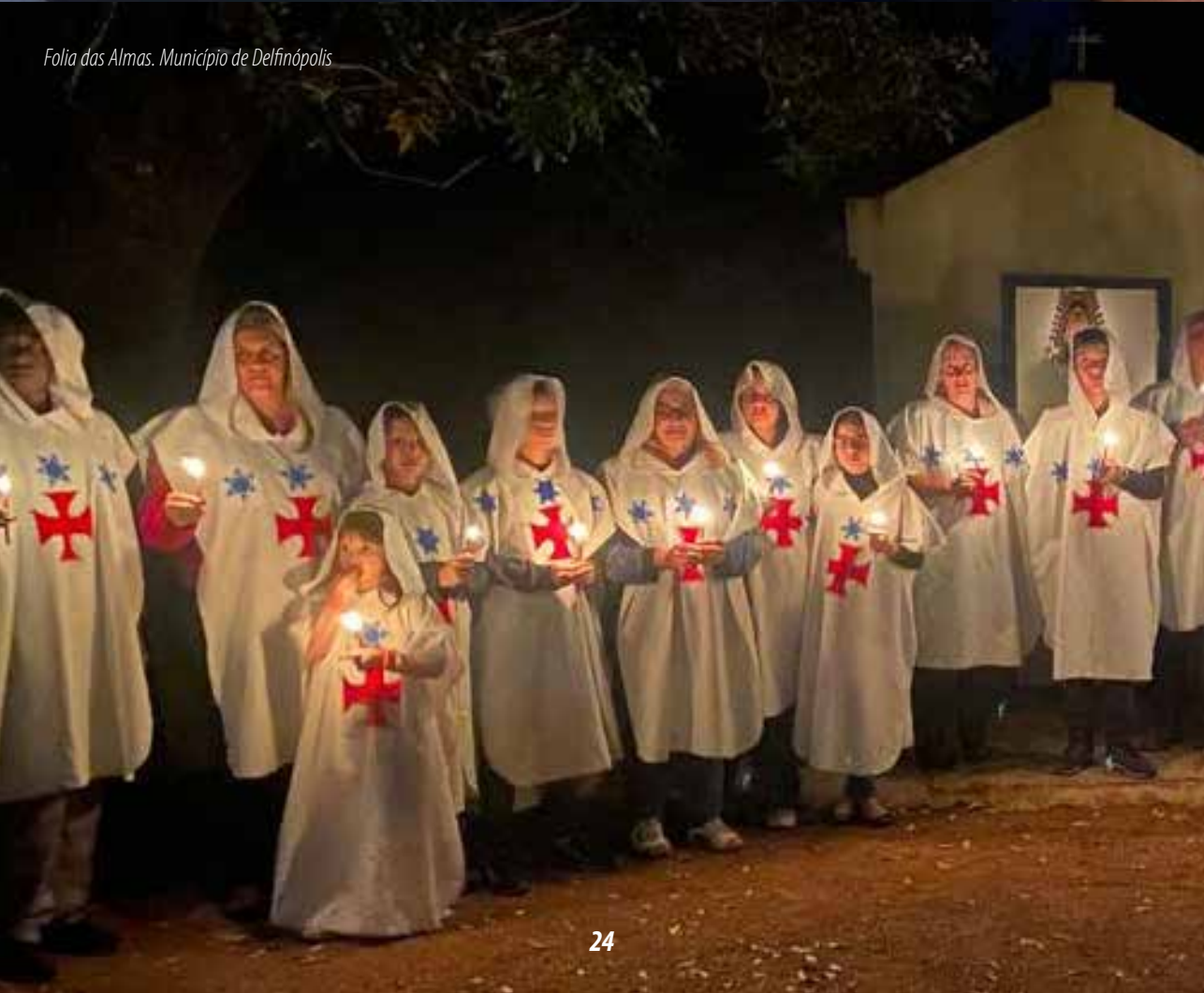
Folia das Almas. Município de Delfinópolis