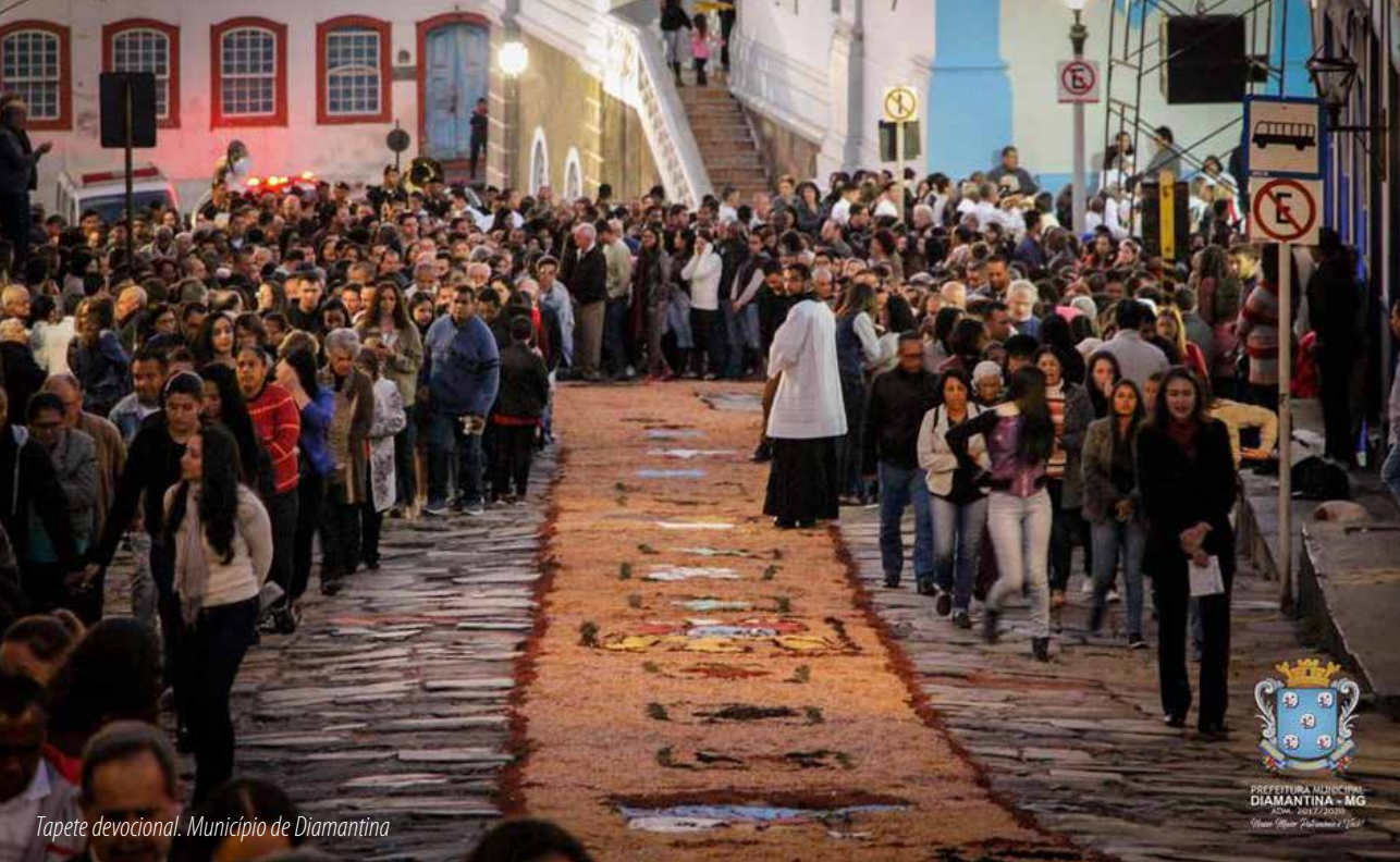
Tapete devocional. Município de Diamantina