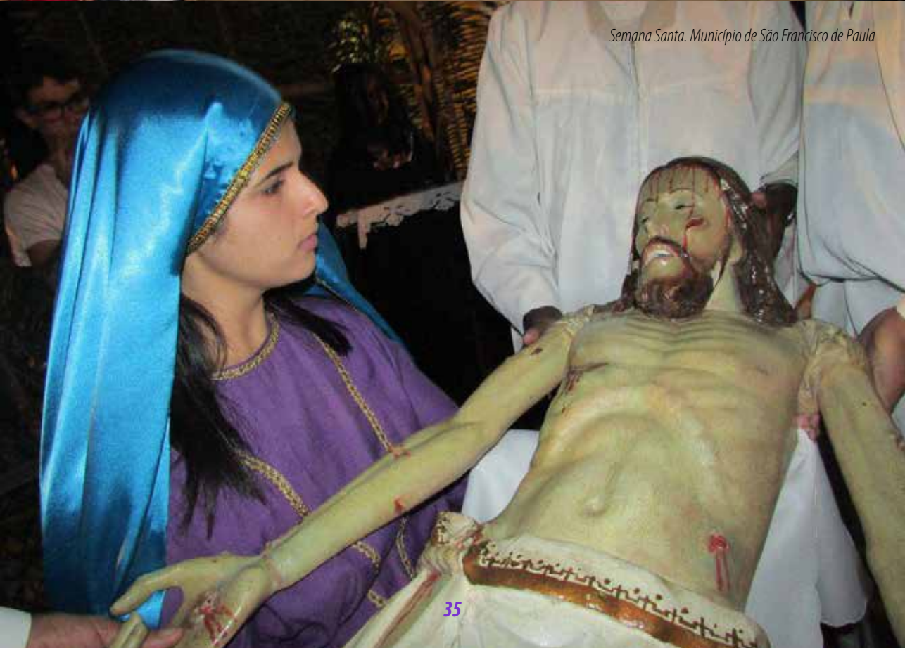
Semana Santa. Município de São Francisco de Paula